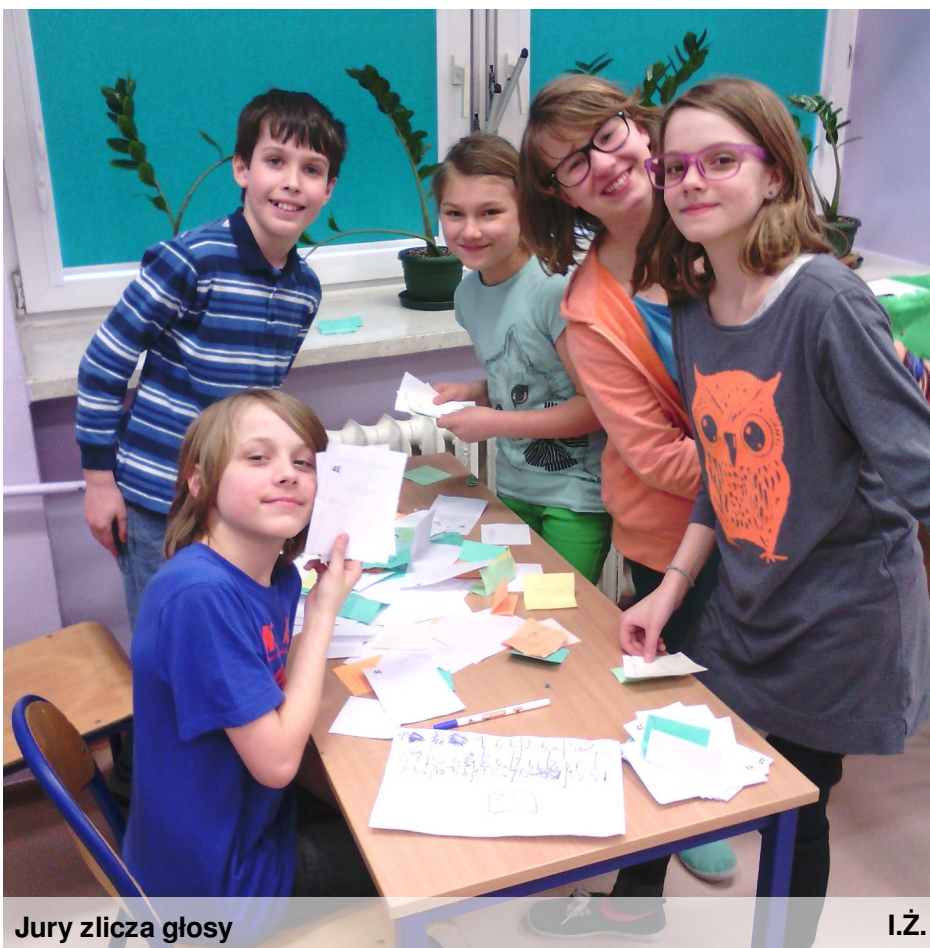
Jury zlicza głosy