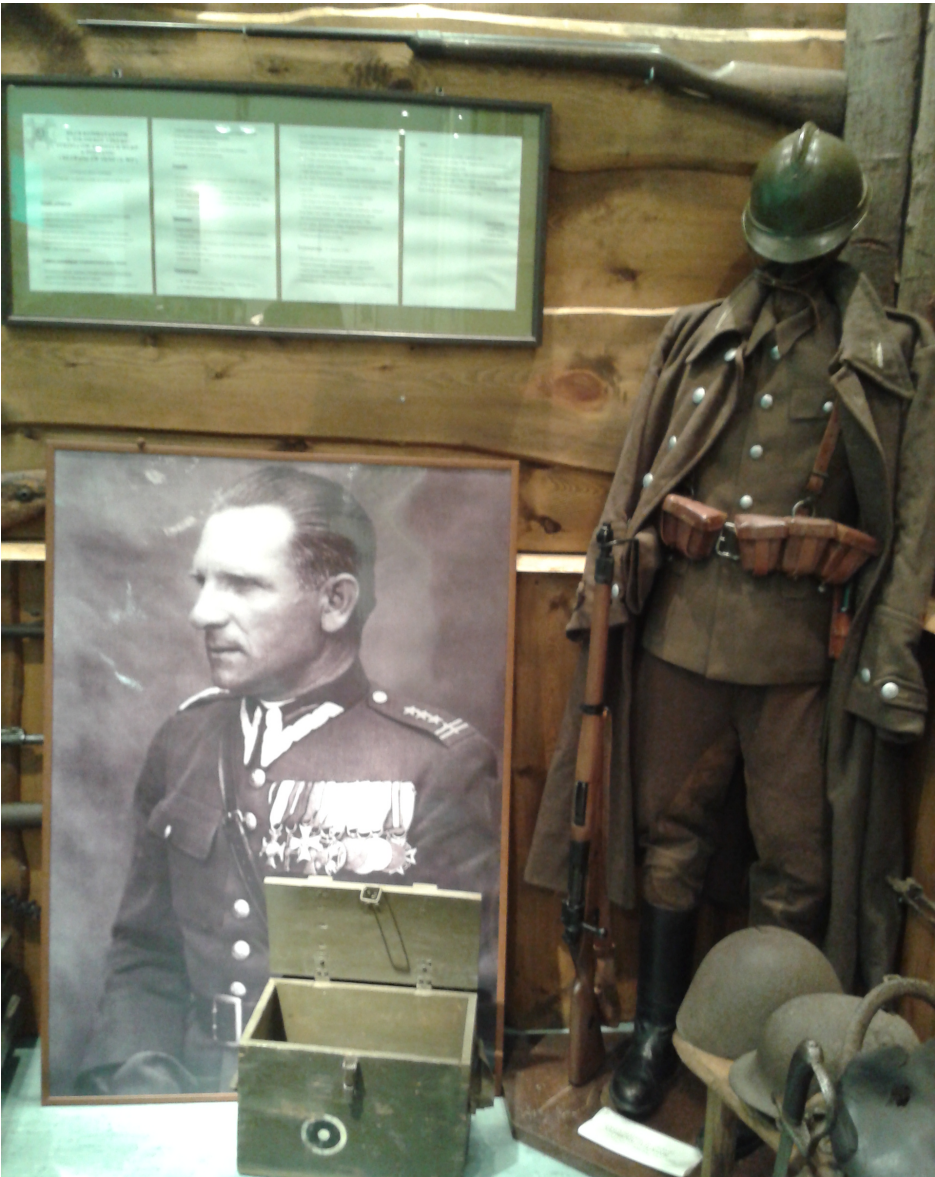
Eksponaty w szkolnym muzeum A. Sakowicz

Izba Pamięci jest często wykorzystywana przez naszych szkolnych historyków .Prowadzone są tal lekcje podczas których uczniowie mogą zobaczyć wiele ciekawych zdjęć, plakatów i map oraz-pod czujnym okiem opiekuna,- przymierzyć hełm, dotknąć CKM, a nawet postrzelać z (zabezpieczonego) muszkietu.