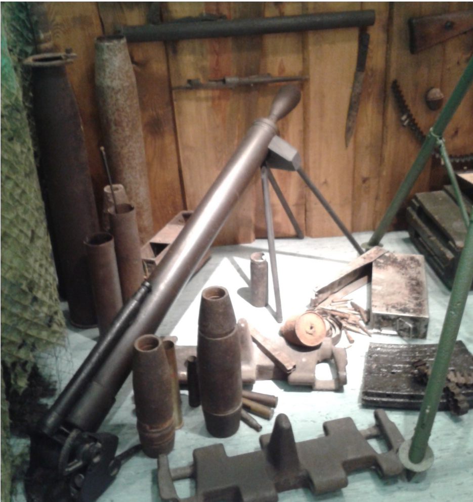
Eksponaty z czasów II wojny światowej A. Sakowicz

Do najciekawszych eksponatów można zaliczyć niemiecki moździerz (81 mm) i Vickers - polski CKM (Ciężki Karabin Maszynowy). Był to bardzo lubiany przez żołnierzy karabin, ponieważ jego ruchoma lufa podczas strzelania napędzała mechanizm przeładowania broni, dzięki czemu działło mogło strzelać bez przerwy nawet wiele godzin. W dość dobrym stanie zachował się również kawalerski mundur i hełm. W szkolnym muzeum znaleźć można także wiele polskich muszkietów. Jest tam nawet kawałek gąsienicy czołgu.